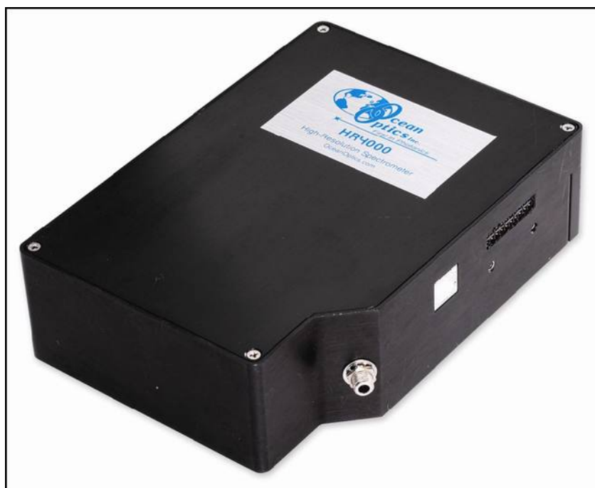
Внешний вид спектрометра HR4000

Спектрометры Ocean Optics соединяются с компьютером через порт USB. Модель HR4000 также позволяет использовать последовательный порт. При подключении по интерфейсу USB 2.0 или 1.1 спектрометр получает питание от компьютера и не требует внешнего источника питания.